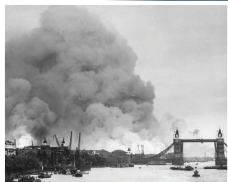
Humo saliendo de Londres después de un ataque aéreo durante el 'Blitz' en la Segunda Guerra Mundial.

El 7 de octubre de 2023, ocurrió lo inimaginable. El mal se desató cuando miles de terroristas de Hamás —acompañados de un bombardeo con 4,300 misiles— penetraron en el interior de Israel y cometieron actos de barbarie contra todos los que encontraban. Aparte del secuestro de más de 250 israelíes, no hubo supervivientes. Jóvenes y ancianos fueron masacrados y torturados. Como si de lobos se tratara, Hamás buscó a las víctimas más indefensas y débiles. Los escuadrones de seguridad y los soldados israelíes que acudieron al sur,