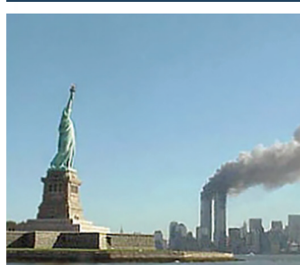
El ataque terrorista al World Trade Center de Nueva York