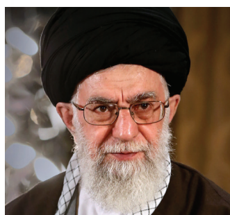
Ayatolá Sayyid Ali Jamenei