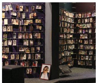
Memorial del genocidio de Ruanda