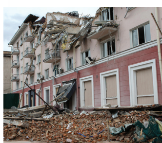
Un hotel en Ucrania destruido por una bomba rusa